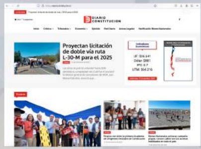
Diario Constitución www.diarioconstitucion.cl